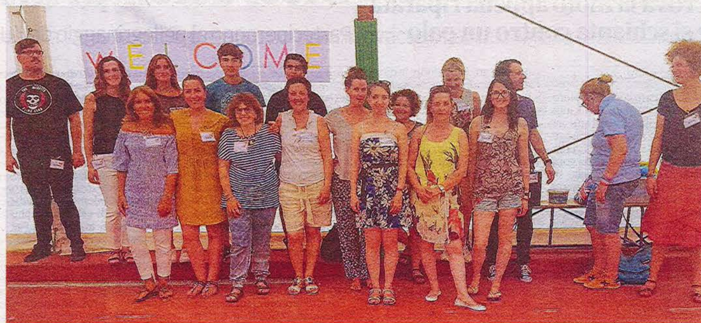
Lo staff coinvolto nel progetto dall'Aisli (Associazione italiana scuole di lingue). In basso, un momento del camp estivo con i bambini

Progetto dell'Aisli a Farindola, coinvolti 12 docenti madrelingua di tutt'Italia